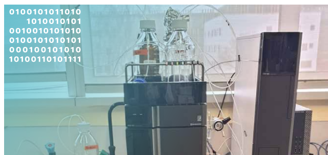
SHIMADZU chaîne chromatographique