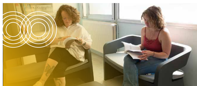
Espace de pause & bibliothèque à l'UFR Psychologie